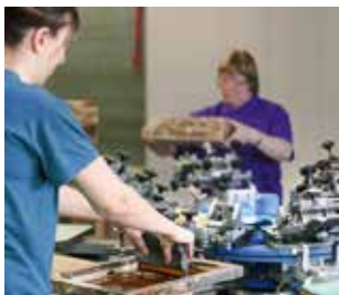
Druck und Design